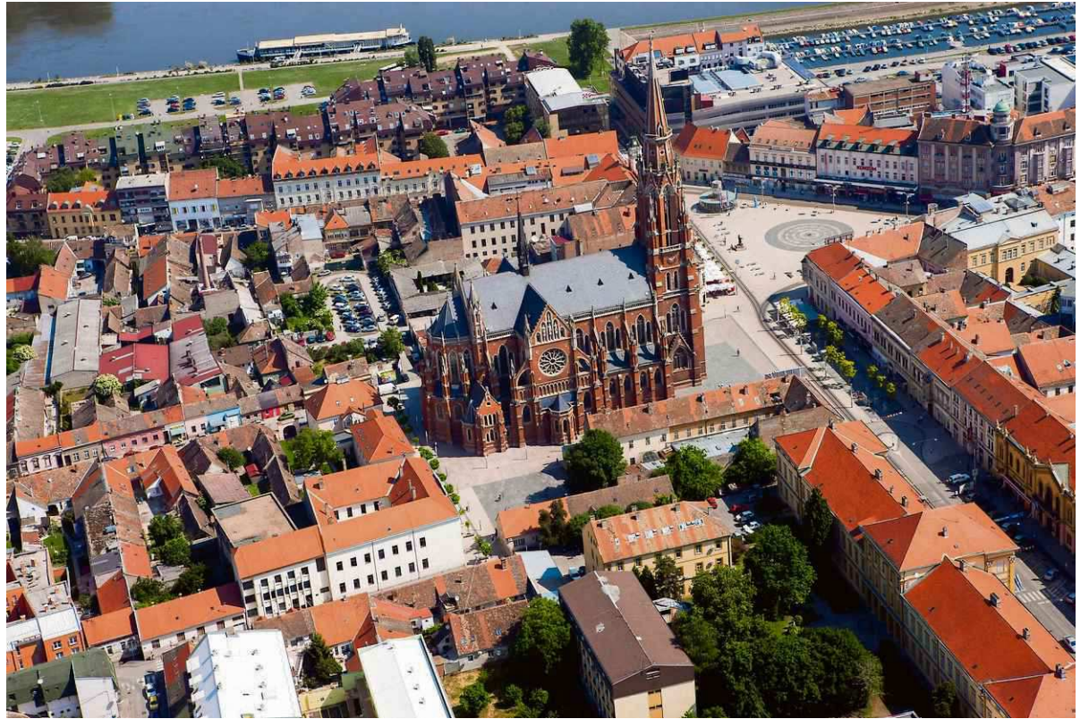
Blik op Osijek, de stad in het oosten van Kroatië.

Kroatië is sinds 1991 een zelfstandig land. De kogelgaten uit de tijd van de burgeroorlog (of bevrijdingsoorlog - alles is een kwestie van perspectief!) die een einde maakte aan de communistische eenheidsstaat Joegoslavië zien we nog dagelijks om ons heen. Het land is inmiddels vijf jaar lid van de Europese